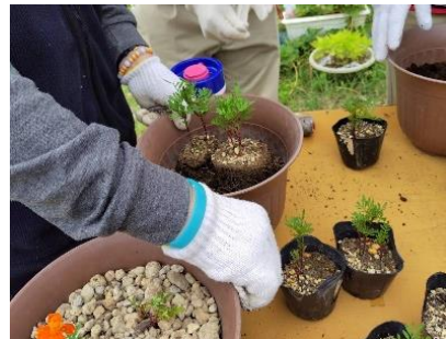
鉢植えした苗は引き続きご自宅や各場所で育てられます。