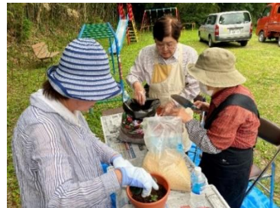
「花が咲くのが楽しみ」参加者は自然と会話も弾みます。